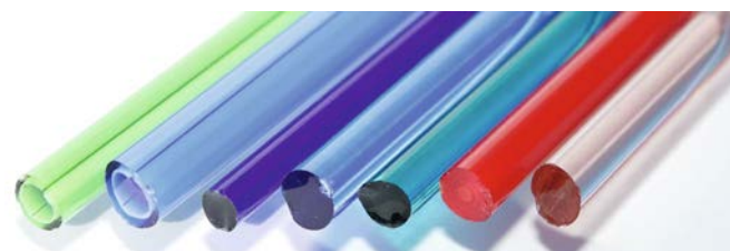
Glasstäbe in alle Farben

Ebenfalls konnten die Besucher über die Siegerperle des diesjährigen Wettbewerbs, der unter der Überschrift „Tag & Nacht“ stand, abstimmen und auf eine der Perlen aus dem Wettbewerb bieten. Der Erlös kommt der Elterninitiative für krebskranke Kinder Jena e.V. zugute. Am Samstag und Sonntag ging es natürlich um die Glasperlen. Bei Life-Vorführungen tauschten sich die Künstler zu neuen Techniken bei der Glasperlen- und Glasschmuckgestaltung aus und unser Hüttenteam zog von Hand Farbglasstäbe aus dem Ofen, was weltweit sonst nirgendwo zu sehen ist.