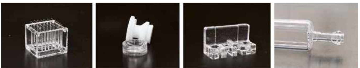
Abbildung 4: Glasapparatebauer Gertjan Bon/Universität Amsterdam stellt im 3D-Druck Quarzglaskomponenten, wie Halter, Verbindungselemente oder komplexe Bauteile her, die auf klassische Weise nur schwer hergestellt werden können.

Die Verbindung beider Technologien eröffnet neue Möglichkeiten in der Forschung, Analytik und Laborentwicklung. Besonders für Prototypen, Kleinserien oder Spezialbauteile bietet der 3D-Druck von Quarzglas einen großen Vorteil: Designs können schnell umgesetzt, getestet und anschließend durch den Glasapparatebau in funktionsfähige Gesamtsysteme integriert werden. So ergänzen sich digitale Konstruktion und Handwerk auf ideale Weise. Der 3D-Druck von Quarzglas ist damit keine Konkurrenz zum Glasapparatebau, sondern eine Erweiterung seiner Möglichkeiten. Die Gruppe von Glasapparatebauer Gertjan Bon an der Universität Amsterdam zählt zu den Pionieren im Glasapparatebau, welcher den 3D-Druck von Glassomer bereits früh zu Herstellung von Verbindungselementen, Durchflusszellen und Analysezubehör und -halter eingesetzt hat (siehe Abbildung 4).