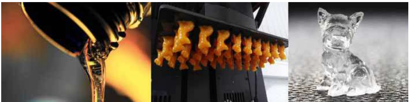
Abbildung 1: Prozessbild vom Druckharz zum Glasbauteil: Das Glassomer Harz kann in Standard 3D-Druckern (SLA, DLP) verarbeitet werden. Durch die UV Härtung entsteht ein sog. Grünling. Dieser wird im Ofen mittels Entbinderung und Sintern zu reinem Quarzglas umgesetzt.

Die Glassomer Technologie basiert auf einem neuartigen Harz, das einen hohen Anteil an Glaspartikeln enthält. Zur Herstellung des Harzes wird ein hochreines Glaspulver in einen flüssigen Binder eingebracht. Die so entstehenden sogenannten Glassomer Materialien können anschließend in einem Kunststoff 3D-Drucker verarbeitet werden, wo sie durch Bestrahlung mit Licht ausgehärtet werden. Der so entstandene Grünkörper wird anschließend im Ofen bei 1.300 °C mittels Entbinderung und Sintern in ein hochreines Quarzglas umgesetzt. Hierbei schwinden die Bauteile üblicherweise um 24 %. Da der Schwund jedoch in alle Raumrichtungen gleich ist lässt er sich bei der Planung einfach und präzise kalkulieren und vorhalten, sodass formtreue Bauteile entstehen. Der Prozess vom flüssigen Material zum fertigen Glasbauteil ist exemplarisch in Abbildung 1 dargestellt.