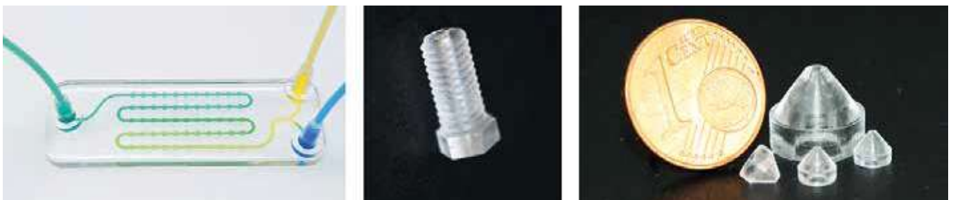
Abbildung 2: Chemisch und thermisch stabile Präzisionsbauteile aus Quarzglas aus dem 3D-Drucker. Glassomer stellt chemikalienresistente Reaktoren mit feinsten Kanalstrukturen und hochtemperaturstabile Düsen her.

Besonders interessant ist diese Technologie überall dort, wo komplexe oder schwer zugängliche Geometrien gefragt sind, beispielsweise bei innenliegenden Kanälen, mikrofluidischen Strukturen oder präzisen Anschlüssen, die sich mit klassischen Methoden nur schwer herstellen lassen (siehe Abbildung 2).